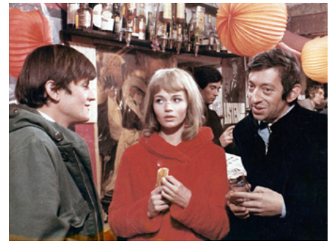
1968 VIVRE LA NUIT de Marcel Camus avec Jacques Perrin, Serge Gainsbourg