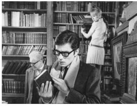
1968 LA MOTOCYCLETTE (Girl on a Motorcycle) de Jack Cardiff