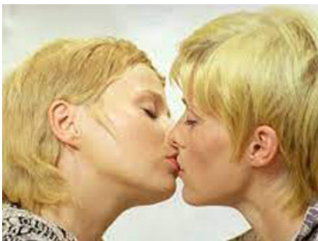
1971 N'A PRIS LES DÉES... d'Alain Robbe-Grillet avec Lorraine Rainer