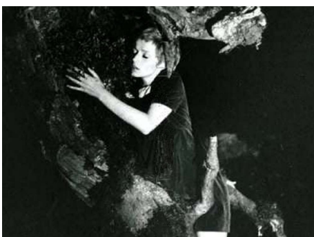
1972 LES RENDEZ-VOUS EN FORÊT d'Alain Fleischer