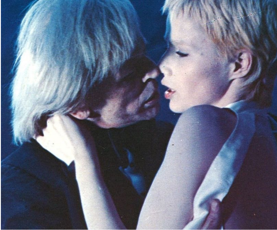
1979 ZOO ZÉRO d'Alain Fleischer avec Klaus Kinski