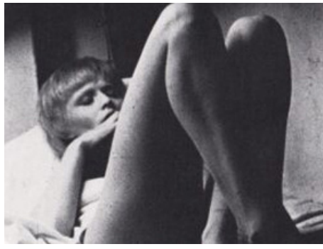
1975 DEHORS-DEDANS d'Alain Fleischer