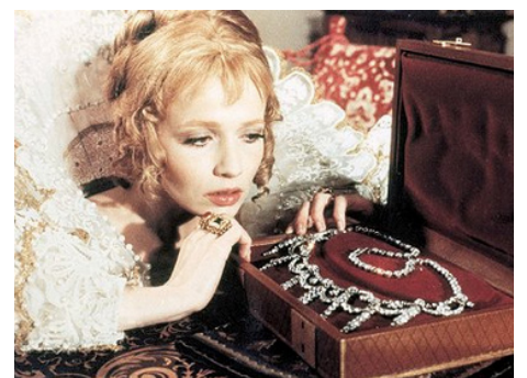
1974 LES QUATRE CHARLOTS MOUSQUETAIRES d'André Hunebelle