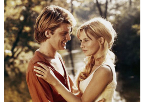
1969 LA LÉGENDE DE BAS-DE-CUIR de Jean Dréville et Pierre Gaspard-Huit avec Robert Benoît