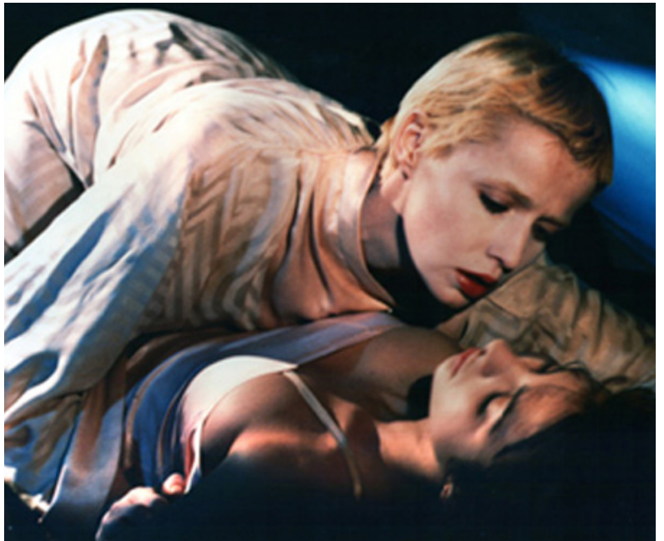
1986 L'ARAIGNÉE DE SATIN de Jacques Baratier avec Alexandra Scicluna