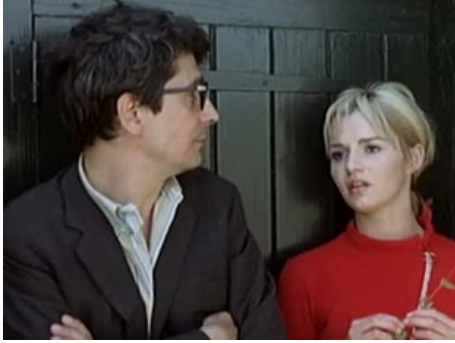
1969 LA CONTESTATION (Amore e rabbia), partie L'Amore de J-L. Godard avec Paolo Pozzesi