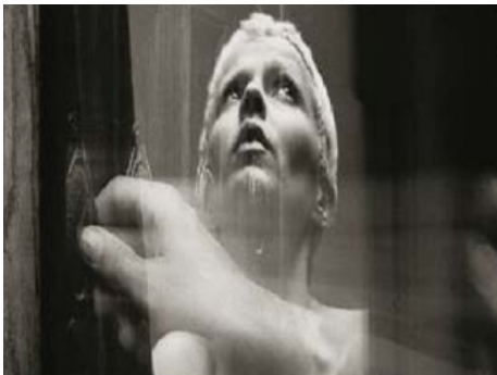
1984 L'AVENTURE GÉNÉRALE d'Alain Fleischer