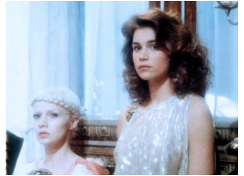
1982 APHRODITE de Robert Fuest avec Valérie Kaprisky