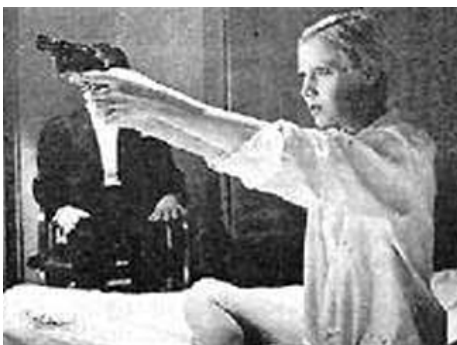
1984 LE DIABLE ET LA DAME (El Diablo y la Dama) d'Ariel Zuniga