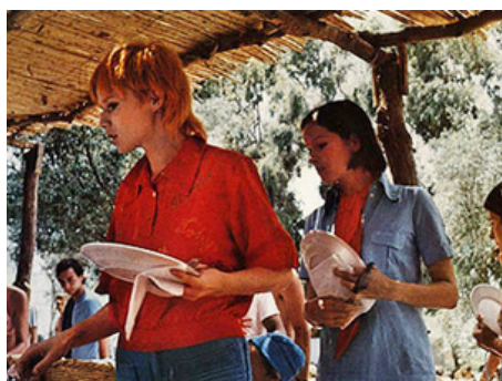
1973 LE MARIAGE À LA MODE de Michel Mardore avec Géraldine Chaplin